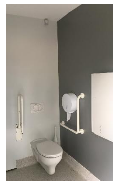
SZP-THW-28 wc épület