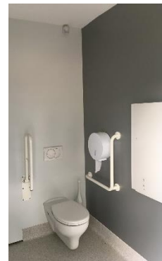
SZP-THW-22 wc épület